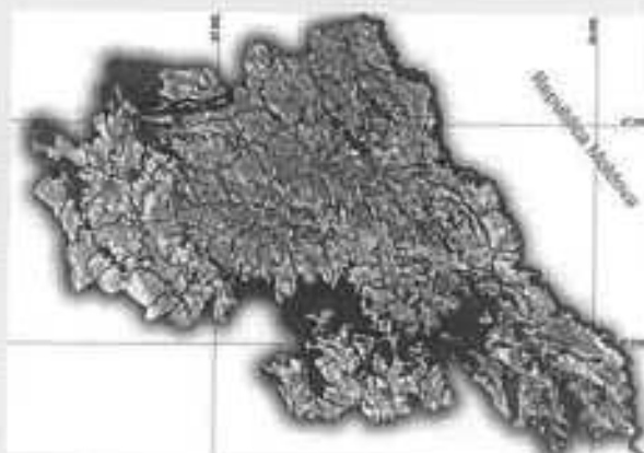
Amplasarea în cadrul județului