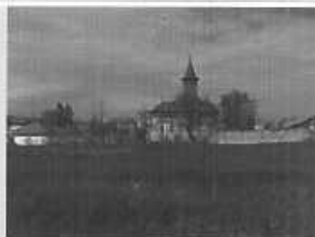
Curtea Domnească din Hârlău, monument istoric