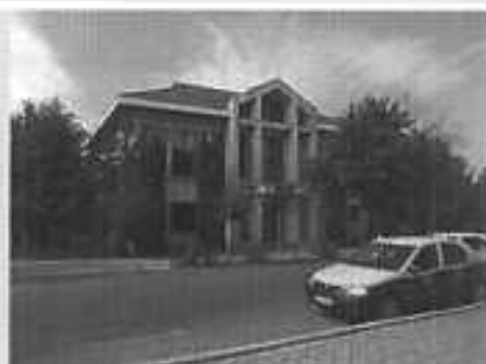
Judecătoria din Hârlău